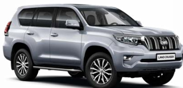
1F7 Сребристо, металик