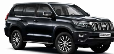
218 Attitude Black, металик

ДОПЛАЩАНЕ* - НЕМЕТАЛИК - 990лв / ПЕРЛА - 1490лв / МЕТАЛИК - 990лв