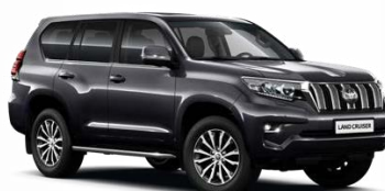
1G3 Графитено сиво, металик