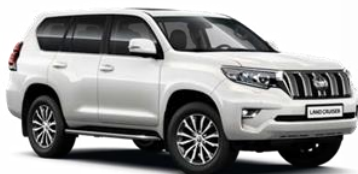
070 Бяла перла